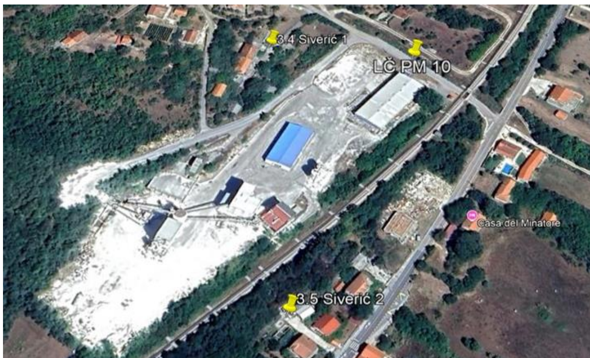
Slika 1. Lokacija mjerne postaje grad Drniš

Mjerna postaja na području grada Drniša postavljena je prema zahtjevima Priloga 1., 2. i 3. Pravilnika o praćenju kvalitete zraka (NN 72/20).